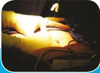
Positionnement de l'anneau sur l'estomac Positioning of the ring on the stomach