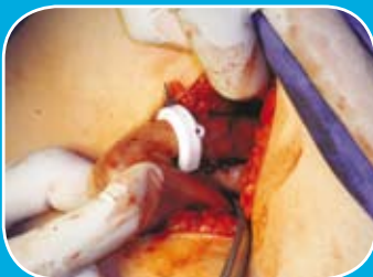
Fixation de l'anneau Fixing of the ring to the stomach