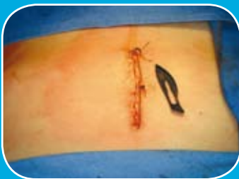
Cicatrice < 7 cm Scar < 7 cm