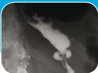
Contrôle radio post-opératoire Post-operative radiography